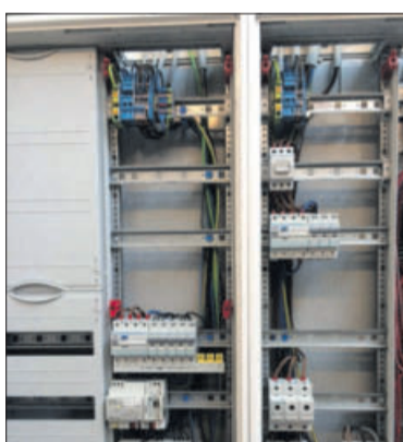
Von der modernen Spülmaschine bis zum Schaltschrank: Elektro Erb ist der Ansprechpartner.