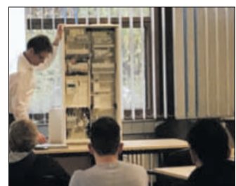
Die Auszubildenden informierten sich direkt bei den Herstellern zu Produkten.